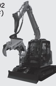
VHB 45000 003 (SK135SR-2F)