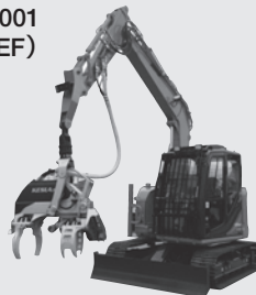
VHC 45203 001 (SK135SR-3F)